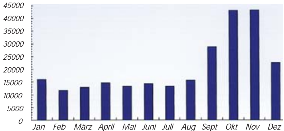
Anzahl der Besucher

Im Jahr 2005 registrierten wir insgesamt 249.918 Besucher auf unserer Website. Sie riefen zusammen 759.461 Seiten auf, also rund drei Seiten pro Besuch. Mit jeweils über 43.000 Besuchern wurde unsere Website in den Monaten Oktober und November am stärksten frequentiert. Das zeigt ziemlich genau das Problem der Jungigel-Funde im Spätherbst.