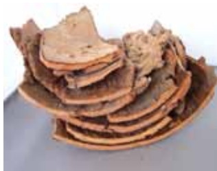
Abb. 6: Ein Rindenstapel. Man muss ein bisschen herumprobieren, bis die Rindenstücke möglichst eng aufeinander liegen.

lunder, Malven. Aber auch Maisstängel, Haselnussruten, Äste aller Art und Dicke kann man für ein Insektenhotel brauchen (Abb. 3).