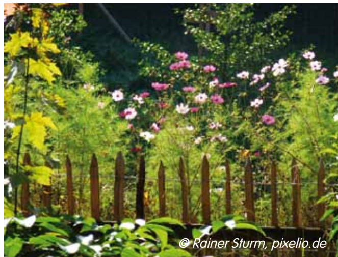
Mitten in der Stadt: Ein Stadtteil-Garten für Mensch und Tier!

In Laatzen bei Hannover soll 2012 inmitten einer Hochhausssiedlung ein Interkultureller Garten „ IG[el]-Garten “ entstehen, eine Zusammenarbeit mit der Universität Hannover ist vereinbart. Das Programm „Toleranz fördern“ finanziert das Projekt, der Kommune entstehen kaum Kosten. Der Verein Igel-Schutz-Initiative