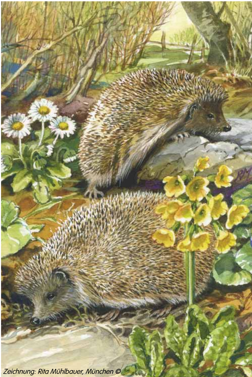
Zeichnung: Rita Mühlbauer, München ©