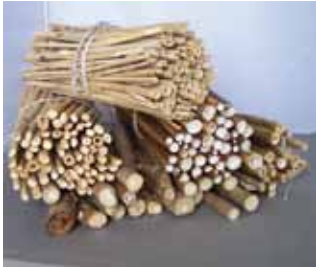
Abb. 3: Gebündelte Abschnitte von allerlei trockenen Stängeln.