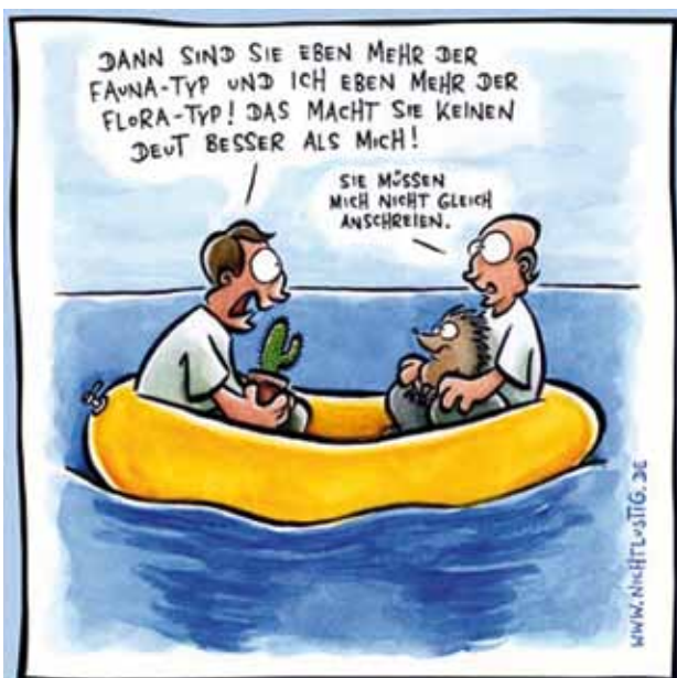
Zeichnung: Joscha Sauer