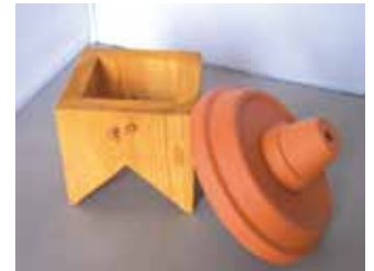
Abb. 2: Die Seitenwände des „Kamins“ sind ca. 9 cm hoch und breit. Auf einen Keramik-Blumenuntersetzer klebt man ein Töpfchen von 5 cm Durchmesser.

Wer sich aber nicht an den Bau einer solchen Luxusherberge wagt, kann auch ausrangierte Wein- oder Obstkisten, angeschlague-