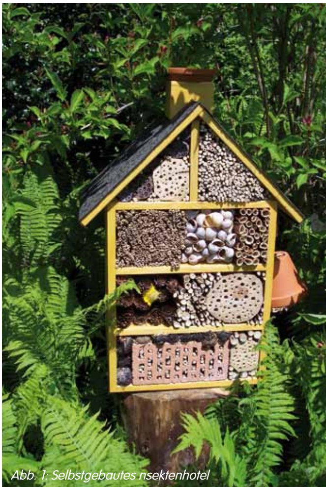
Abb. 1: Selbstgebautes Insektenhotel

Hohlstängel oder solche mit Mark kann man im Herbst in jedem Garten „ernten“ oder in den Grünabfallboxen finden. Besonders gut geeignet sind Schilf, Bambus, Sonnenblumen, Ho-