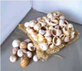
Abb. 4: Strohegefülltes Jutesäckchen mit aufgenähten Schneckenhäusern.