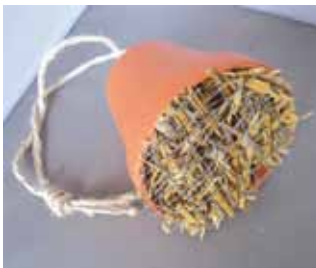
Abb. 5: Ein kreisförmig geschnittenes Stück Drahtgeflecht verhindert, dass das Stroh aus dem Topf herausfällt.